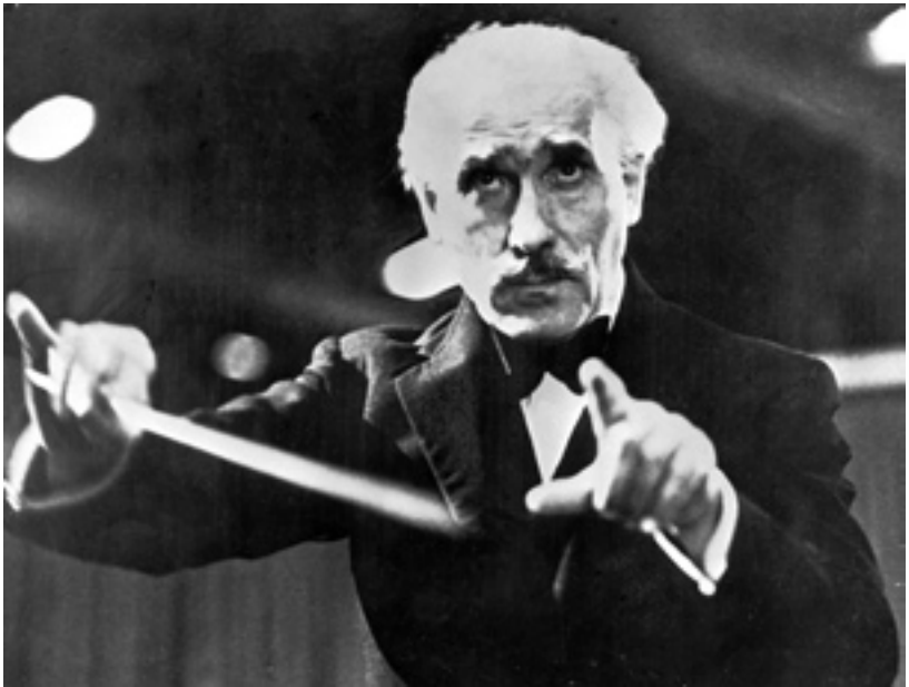
University of Michigan Library Services